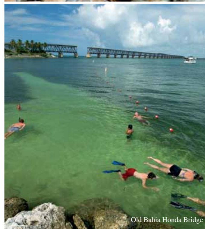
Old Bahia Honda Bridge