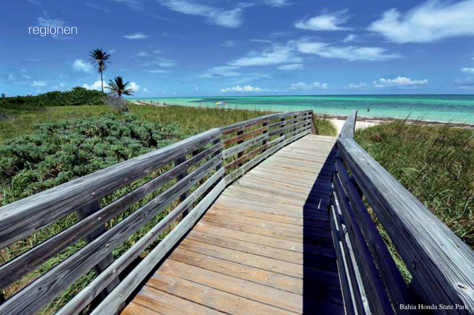
Bahia Honda State Park