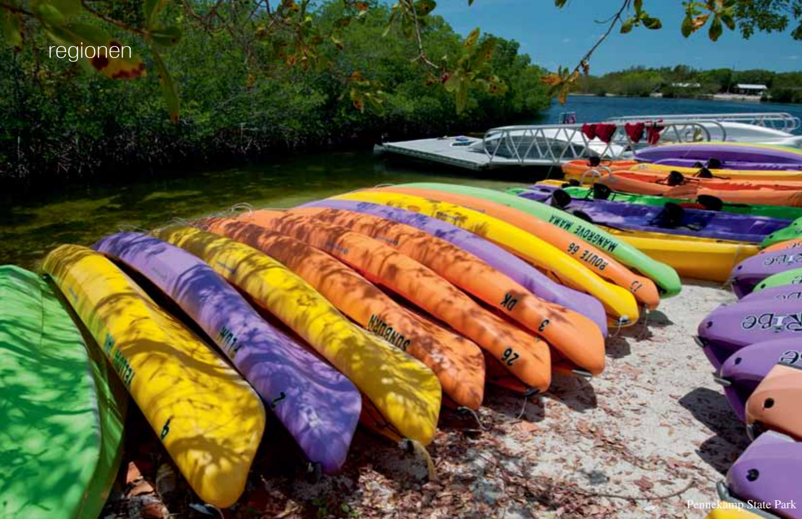
Pennekamp State Park