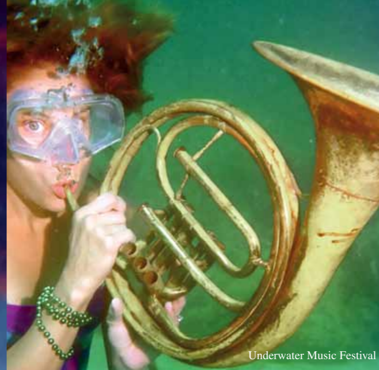
Underwater Music Festival