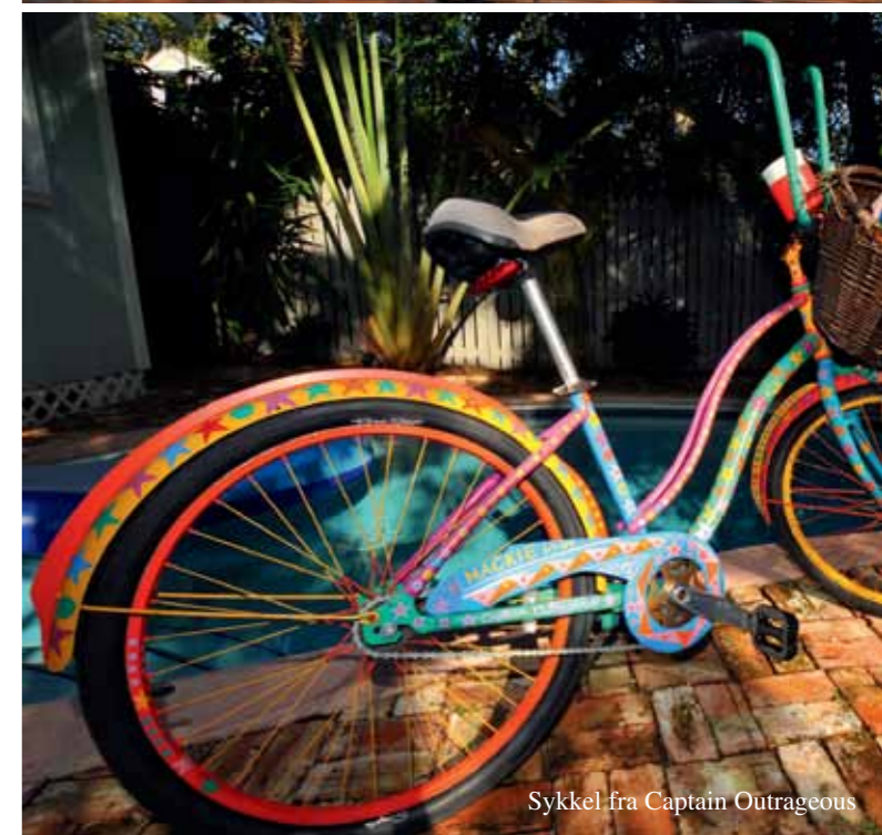
Sykkel fra Captain Outrageous