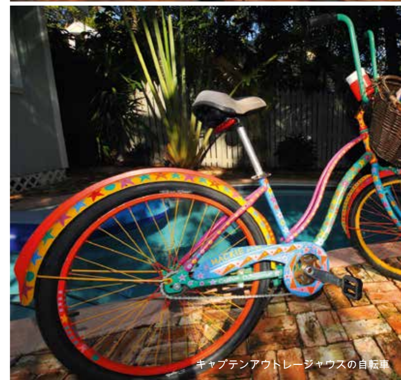
キャプテンアウトレージャウスの自転車