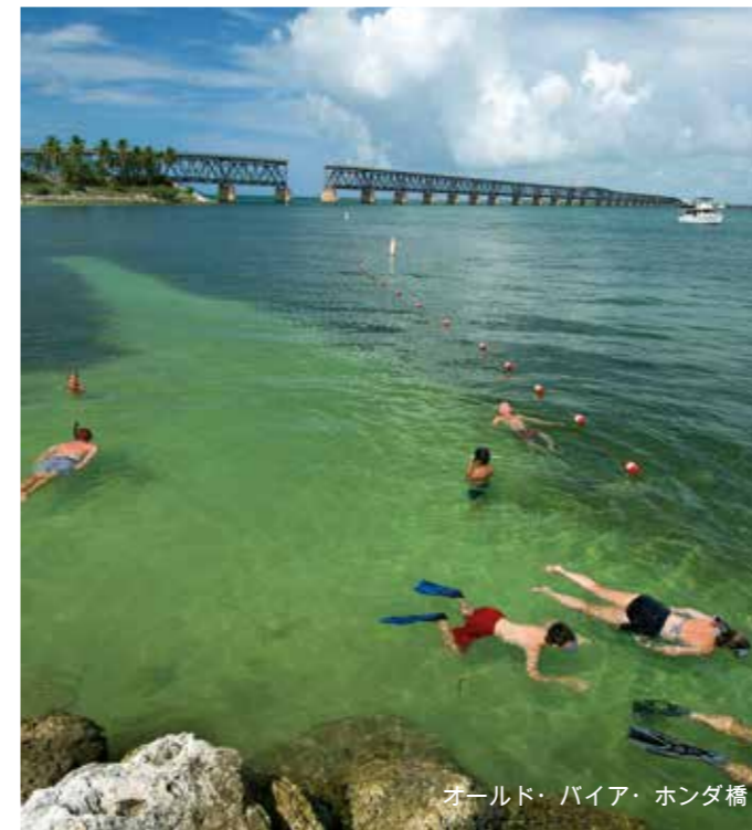
オールド・バイア・ホンダ橋