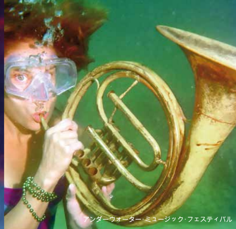
アンダーウォーターミュージックフェスティバル