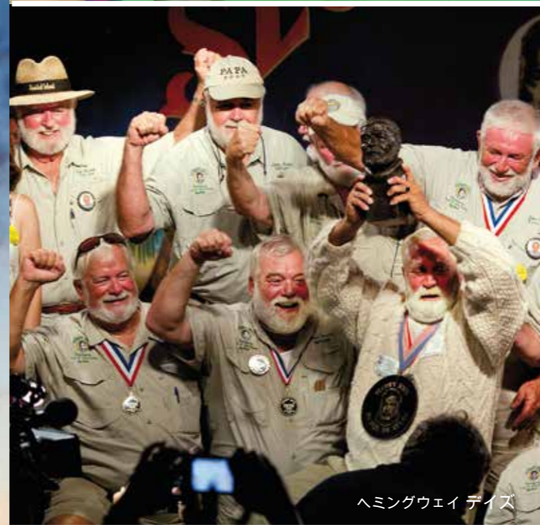
ヘミングウェイデイズ