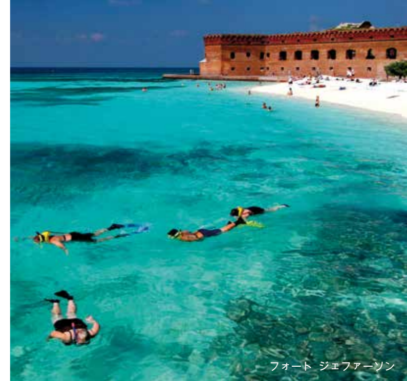
フォート ジェファアソン

キーウエストの周辺では何百もの野生のイルカが生息しています。ドルフィンサファリ(港から)に参加して、自然環境で動物を見ましょう。ダイバーには美しいサンゴだけではなく、160mの長さの難破船ヴァンデンバーグ(米国の軍艦)などがあります。ロマンティックな雰囲気をお望みですか?では、サンセットクルーズを予約して下さい。