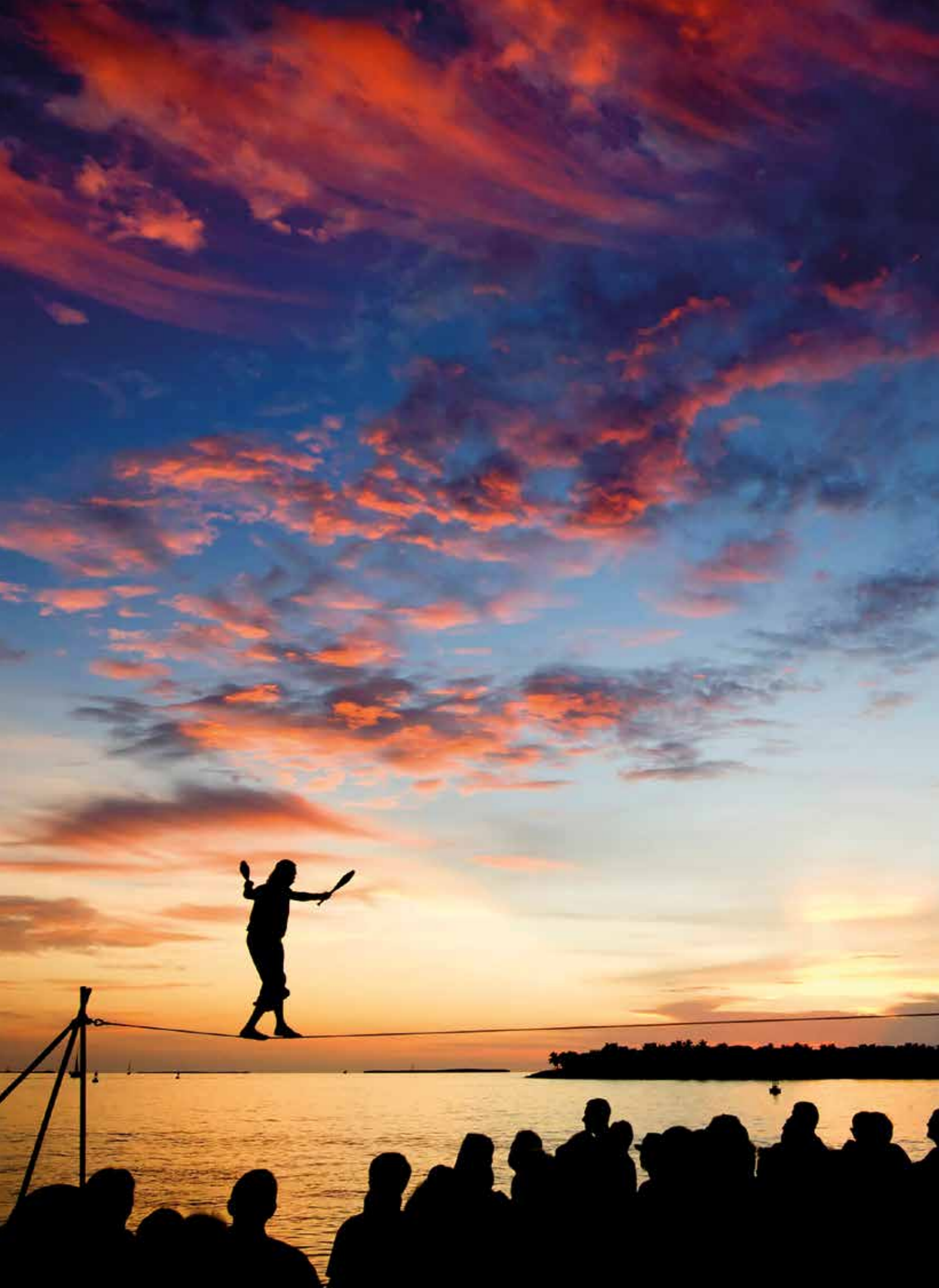
マロリースクエア

フェスティバルに関する更なる情報は www.fla-keys.com/calendarofevents