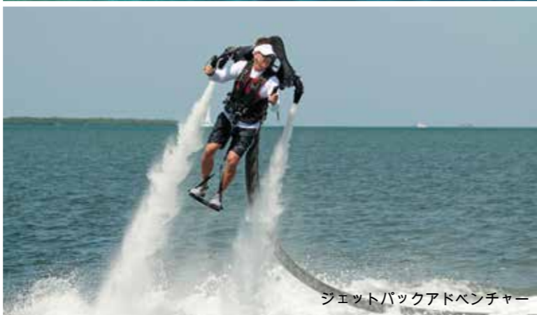
ジェットバックアドベンチャー