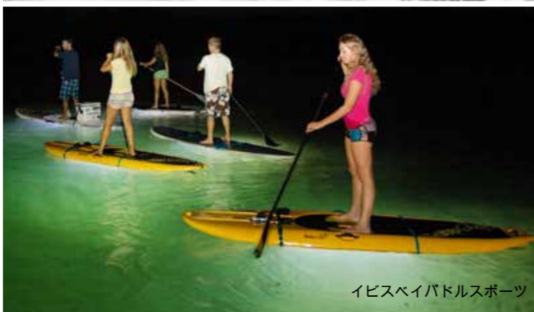
イビスベイパドルスポーツ