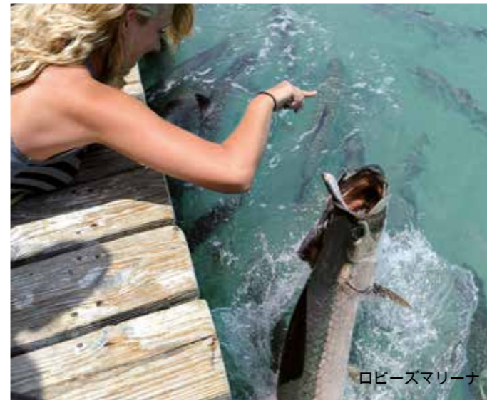
ロビーズマリナー

ス’はドックの近くで、あなたの手から魚を盗むために水の中から高くジャンプします。その魚を拾おうとしているペリカンの監視の目の下で。ロビーズマリナーからもカヤックとパドルボードのツアーを提供しています。MM77.5ベイサイド