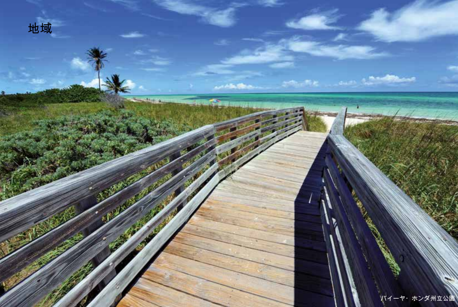
バイーヤ・ホンダ州立公園