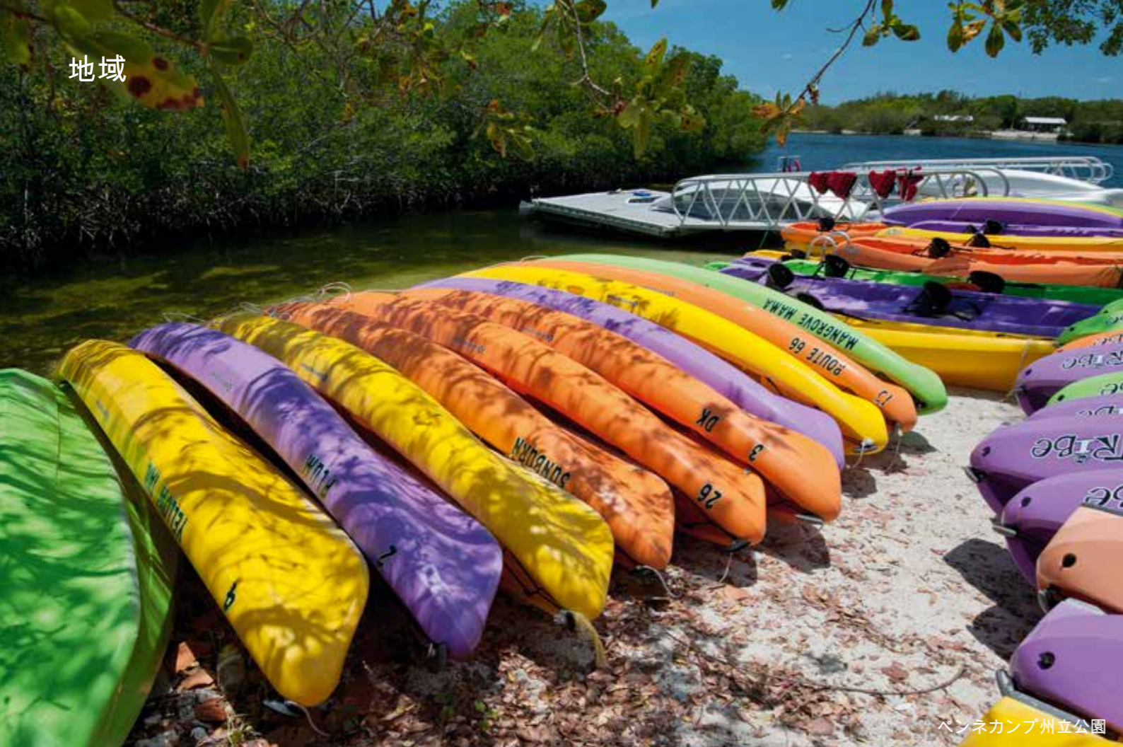
ペンネカンブ州立公園